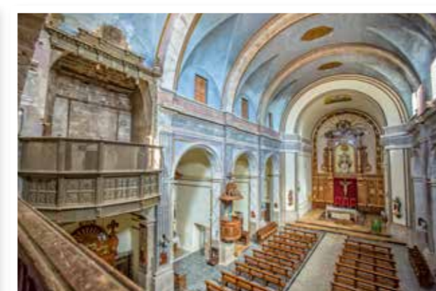
Església de l'Assumpció