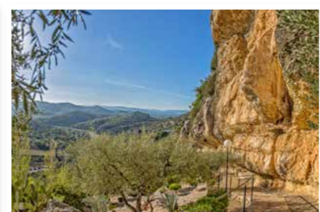
Àrea de la Cova Fonda