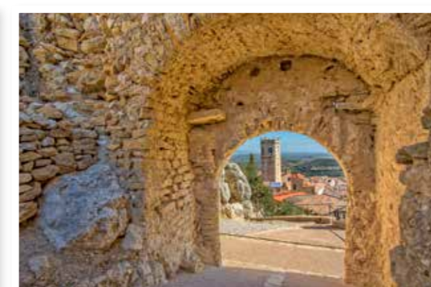
Castell - fortalesa