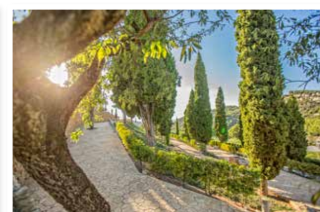
Parc Manuel Segarra