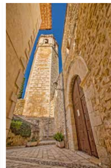
Torre - campanar